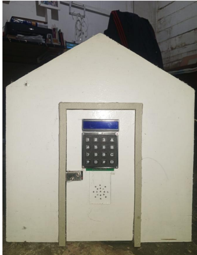
Gambar 2. Implementasi Hardware (Tampak Depan)